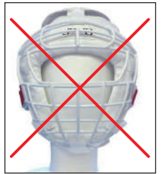
②マーシャルワールド製イサミ製面付きヘッドギア