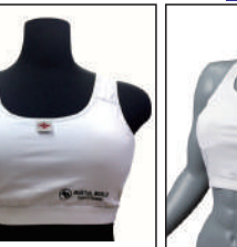
②グラチャン指定チェストガード