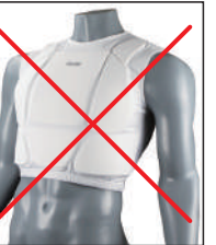
③イサミ製インナーベスト