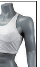
③イサミ製イサミスポーツブラ